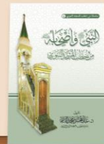
ANNABI MUHAMMADU DA SAHABBANSA