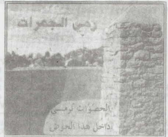
ረሚ ጀመራት እትድርቡሉ ቦታ ዘርኢ ስእሊ