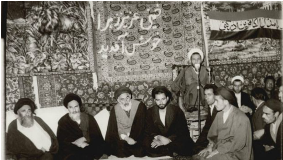
آیت‌الله خمینی در قم بعد از آزادی از حبس خانگی در قیصریه تهران

به نظر می‌رسد که آیت‌الله خمینی در نجف انتظار نداشت که رویای حاکم شدنش به این زودی‌ها محقق شود چرا که در کتاب "ولایت فقیه و جهاد اکبر" به صراحت گفته که "این هدفی است که احتیاج به زمان دارد".