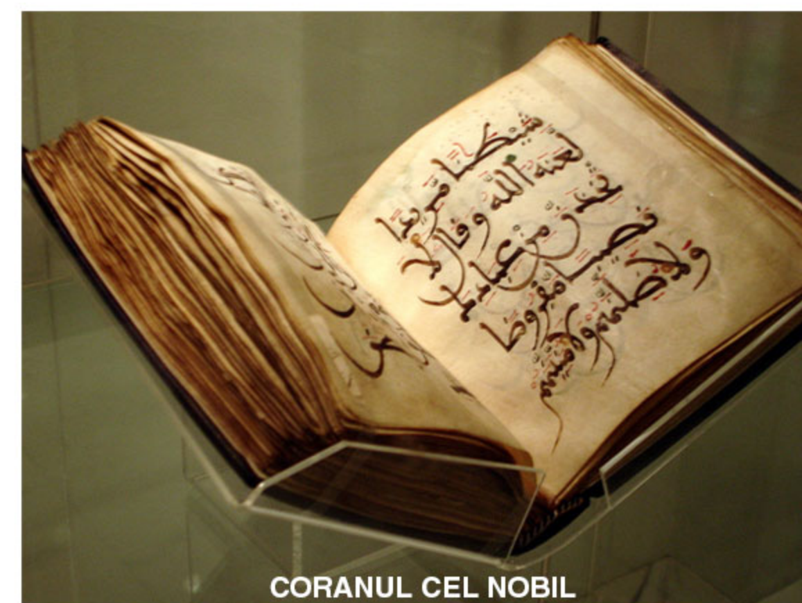
CORANUL CEL NOBIL