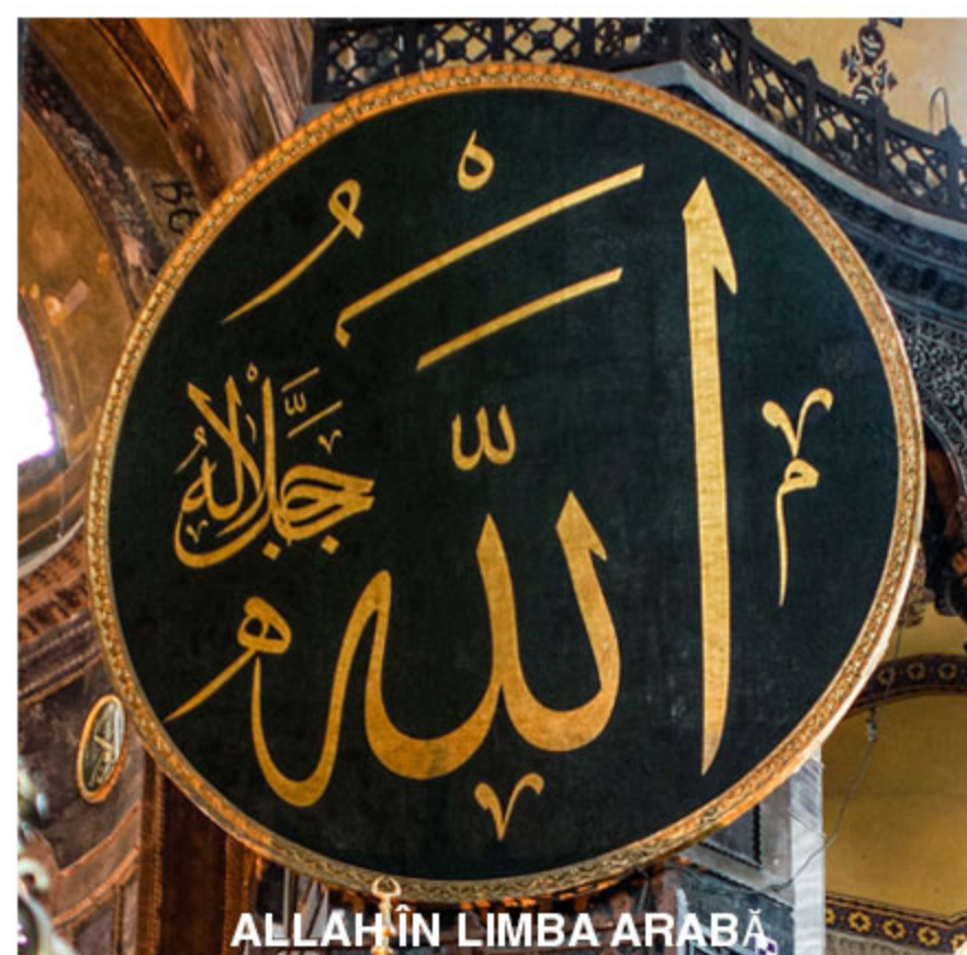
ALLAH ÎN LIMBA ARABĂ

Musulman: acel individ care se supune voinței Singurului Dumnezeu Adevărat (Allah), Creatorul.