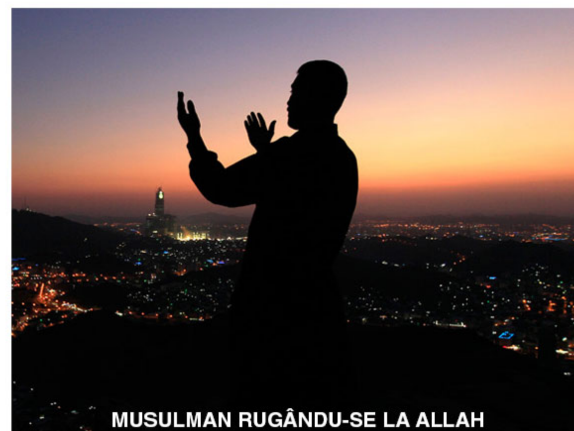
MUSULMAN RUGÂNDU-SE LA ALLAH