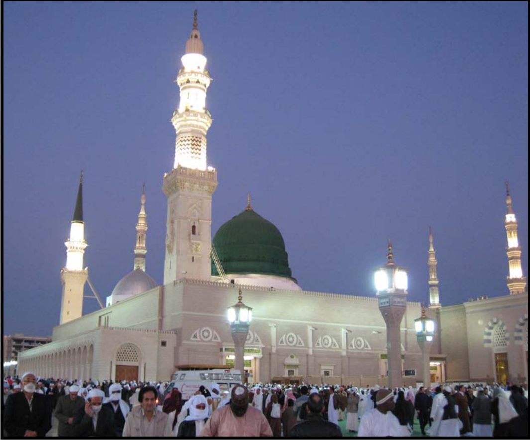
المسجد النبوي بالمدينة المنورة